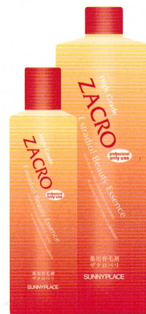
【業務用】 360ml・1,000ml (詰替用)